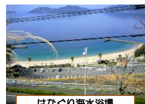
はなぐり海水浴場