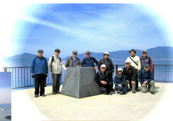
海上プロムナードで集合写真