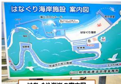
はなぐり海岸の案内図