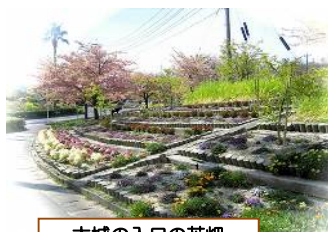
大城の入口の花畑