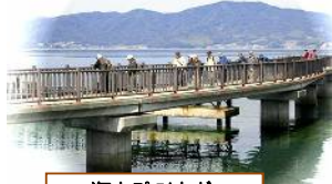
海上プロムナード