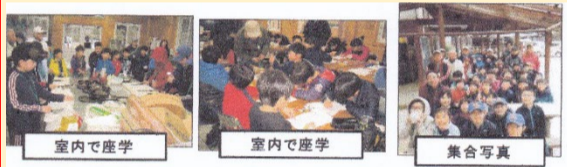
室内で産学 室内で産学 集合写真

3/10(日) 第 2 回環境学習講座開催「森で遊ぼう」in 須々万 当日雨の為、午前中は室内で「森の植物について」「森の役割と働きについて」の話を聞き、地球温暖化防止のために森が如何に大切かを学んだ。午後は竹トンボ作り、廃材を利用してのピザ焼、まき割り体験などを楽しく遊びながら学んだ。 児童(30名)、保護者(6名)、指導者(2名)、スタッフ(9名)の総勢 47 名