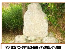
文政3年設置の鶴の墓