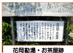
花岡勘場・お茶屋跡