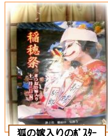
狐の嫁入りのホースー