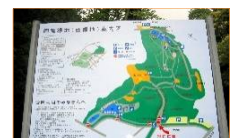
西緑地公園案内看板