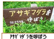
アサギモダラを呼ぼう