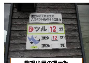
監視小屋の掲示版