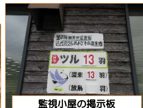
監視小屋の掲示板